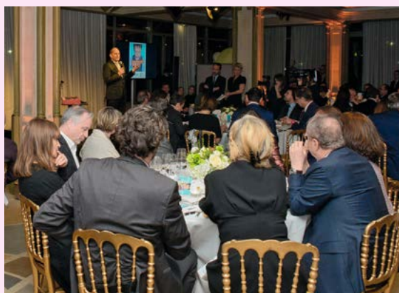
Vente aux enchères au Pavillon Ledoyen.

Une magnifique soirée solidaire réunissant de nombreux partenaires et mécènes au grand cœur, qui a permis de collecter 856 350 € au profit de la recherche en pédiatrie à Gustave Roussy.