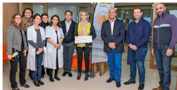
Remise de chèque des Amis de Mikhy.

L'association « Les Amis de Mikhy » s'engage pour le développement des soins de support pédiatriques et notamment pour qu'une prise en charge psychologique puisse être proposée de façon systématique à chaque enfant atteint d'une tumeur cérébrale. Le 18 janvier dernier, elle a remis un chèque de 80 000 € à Gustave Roussy, soit un total de 160 000 € reversés à l'Institut pour l'année 2017. Un grand merci !